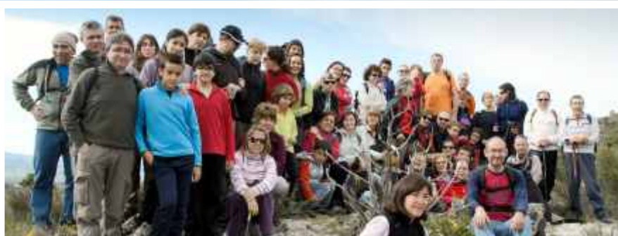
Foto dels "picoseros" amb el president i vicepresident de la FEEC, a la festa homenatge als Pioners dels GR's a Sant Blai de Tivissa.

Nodrida assistència a l'excursió de la Setmana Cultural al Barranc de La Foig