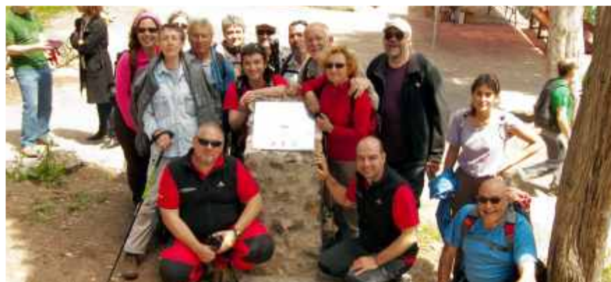
Foto de grup al cim del Puigpelat, punt culminant dels Motllats

Foto dels "picoseros" amb el president i vicepresident de la FEEC, a la festa homenatge als Pioners dels GR's a Sant Blai de Tivissa.