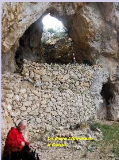
El Camí de Muntanya de Sirga

Aquest any un nou equip empen la responsabilitat d'organitzar aquesta cursa que ja es pot dir que és una clàssica consolidada. Cada any ha gaudit d'una millor organització, han augmentat els atractius i la duresa i de ben segur, ara ja és un referent entre els atletes més esforçats i valents dels circuits de muntanya. Però no seria possible si nosaltres no hi donem el nostre suport, si no participem i col·laborem amb els organitzadors, massa sovint algunes curses que eren un referent, es deixen de fer quan manca la col·laboració, per això us convoquem a participar, com a caminants o com a controls, en l'organització o amb la vostra participació, la Cursa només és possible amb l'ajuda de tots i totes. Aquest és un acte que projecta a Móra d'Ebre, a La Ribera d'Ebre i a La Picossa en l'àmbit de l'elit de l'esport de muntanya, és molt important que el resultat sigui positiu per a tots aquells que venen a participar d'arreu de Catalunya.