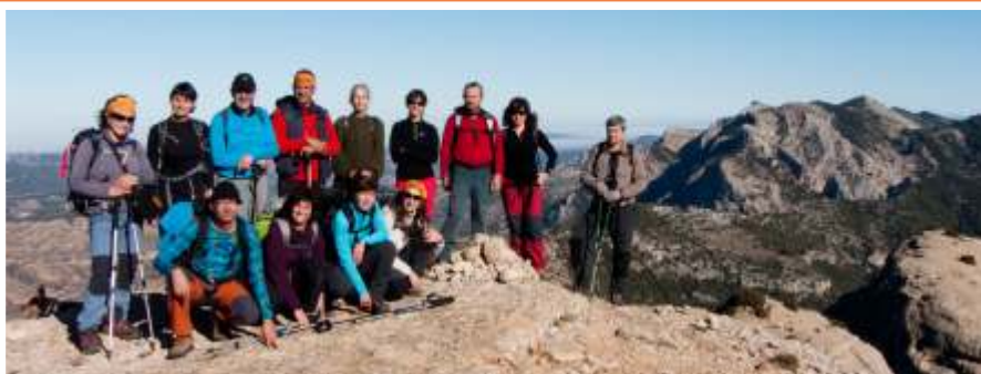
Al cim de Les Roques de Benet, en una jornada espectacular.