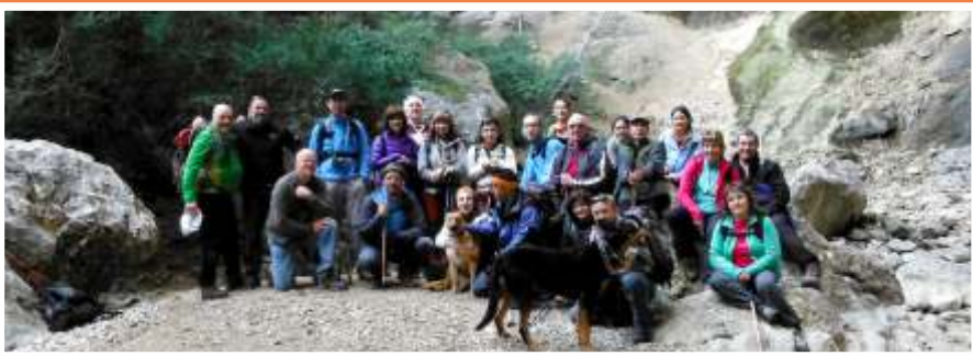
Sota la bella cúpula de la Cova de la Gralla, fem la foto de grup d'aquesta bella excursió.