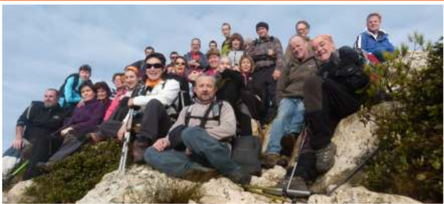
La Tossa, punt àlgid i pricipi de la llarga cresta de Les Cabreses.