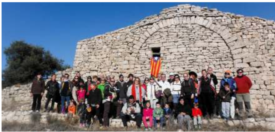
Nodrida assistència i magnífica organització a la ruta de pedra en sec de la Festa de L'Oli de la Fatarella.