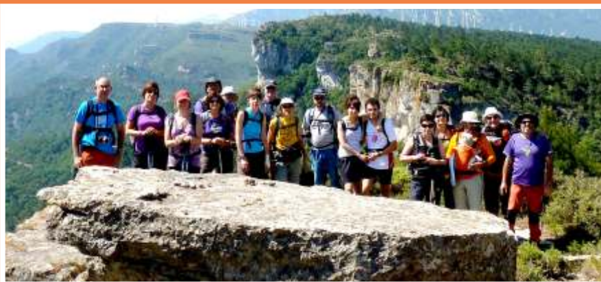
A Portell de Trucafort, foto de grup en un paratge excepcional.