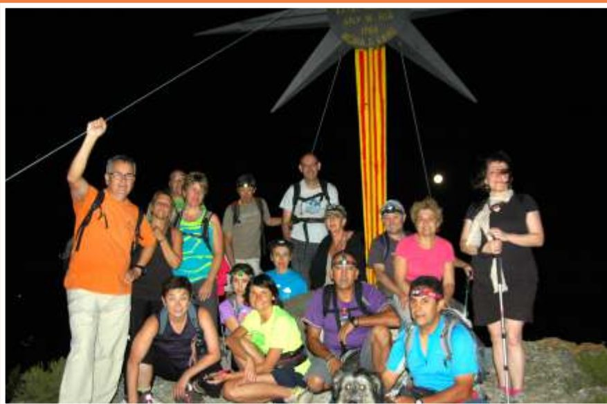
La nostra bella nocturna, que aquest any va seguir una ruta diferent, amb un mateix final.