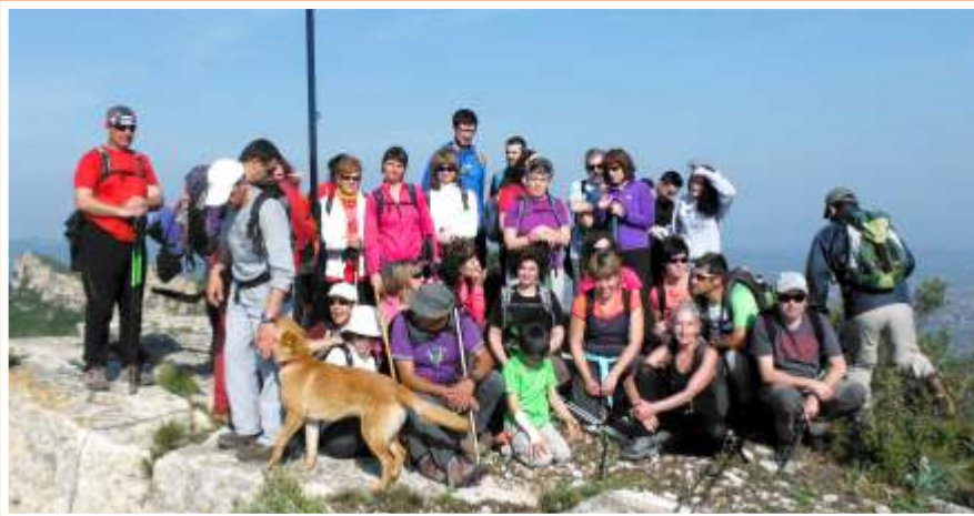
Foto del cim al Puig d'Aguilar. una bella ruta que va tenir nombrosa participació.