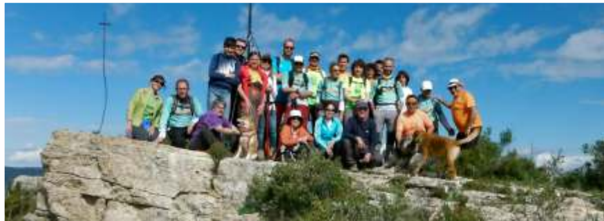
Foto de cim al Pic d'Aguilar, punt culminant de la ruta de la Primavera Cultural i també de la Cursa del Camí de Sirga