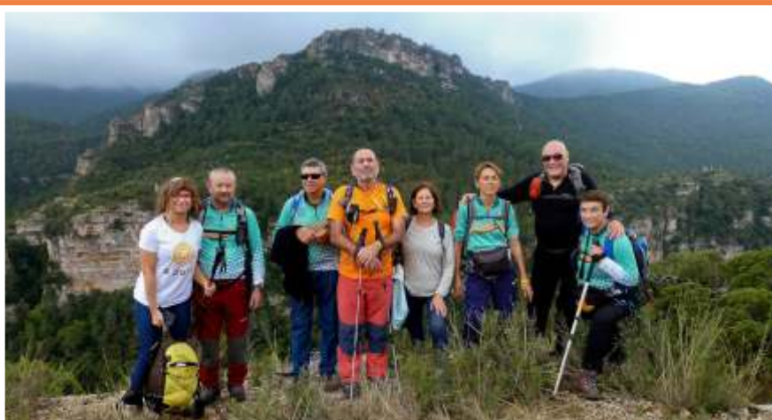
Foto de grup als Miradors, un panoràmic punt per on ens va portar el 52é Camí de Muntanya de la 4ª Regió.