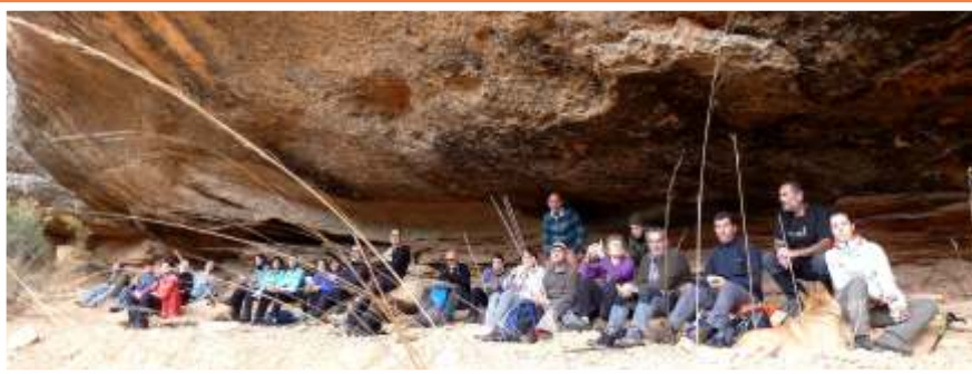
Esmorzant a la Cova del Polvorí, una ruta molt especial pels contorns de Bot, paisatge i aventura es conjuguen.