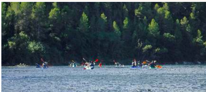
Palejant pel Pas de Barrufemes amb els caiacs a la baixada picossera de Miravet a Benifallet.