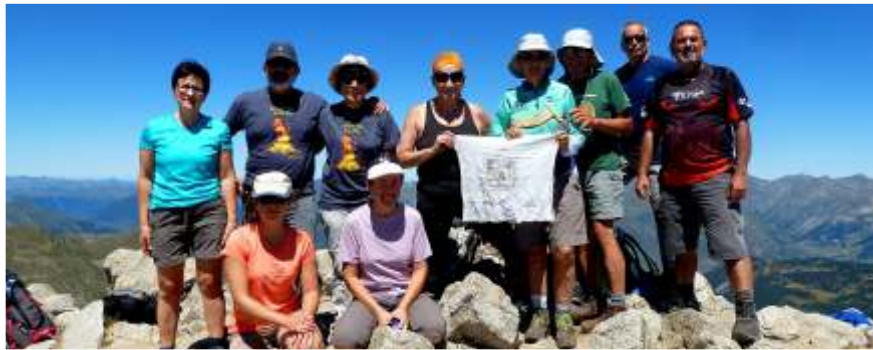
Al cim del Montardo d'Aran, un magnífic mirador per a un exigent recorregut.