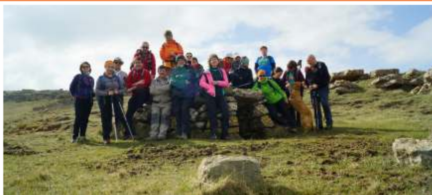
Tot el grup assistent a Pouet de la Mola de Coldejou, una excursió molt especial i diferent.