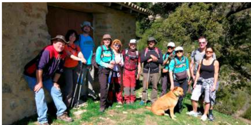
A Montsant, en una excursió especial que transitava espais poc coneguts de la serra.