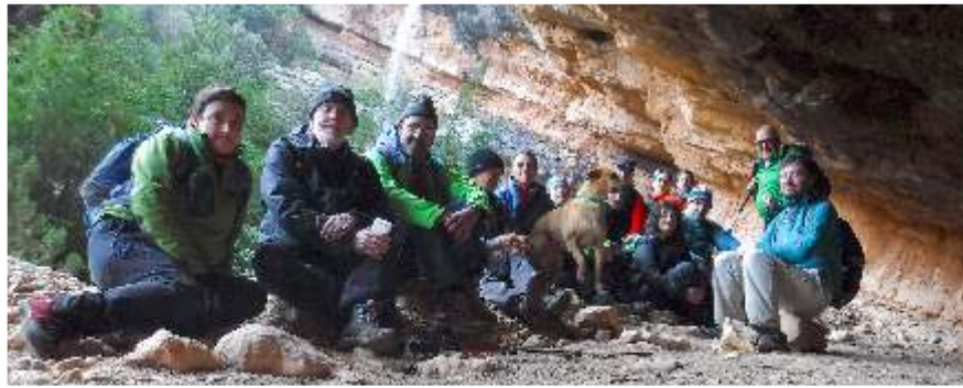
Foto de grup al cingle de la Cova del Moro d'Arnes.