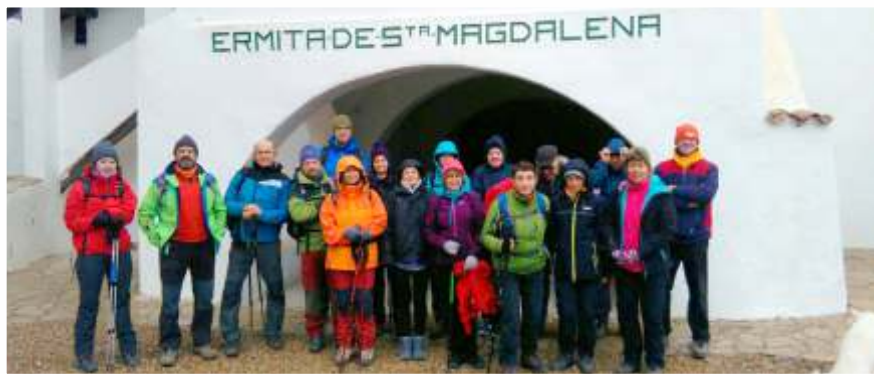
A l'ermita de Santa Magdalena de Garcia, una excursió preciosa, amb un temps una mica complicat.